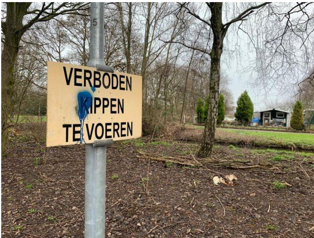
'Verboden kippen te voeren', op de achtergrond zijn drie dode dieren te zien.